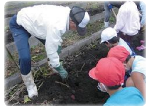
地域の方との体験活動(生活科)