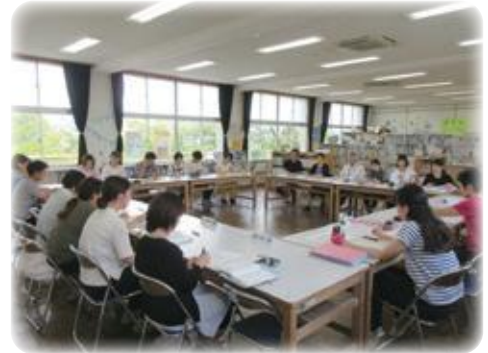
校区幼保小連携推進協議会の開催