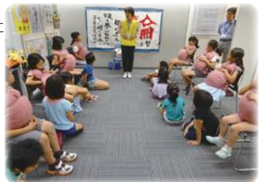
妊婦擬似体験活動