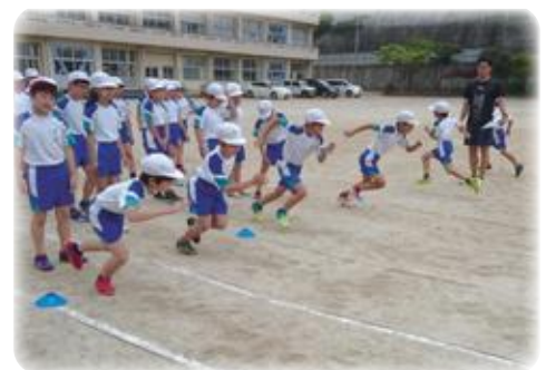
運動指導者の派遣による授業(陸上運動系)