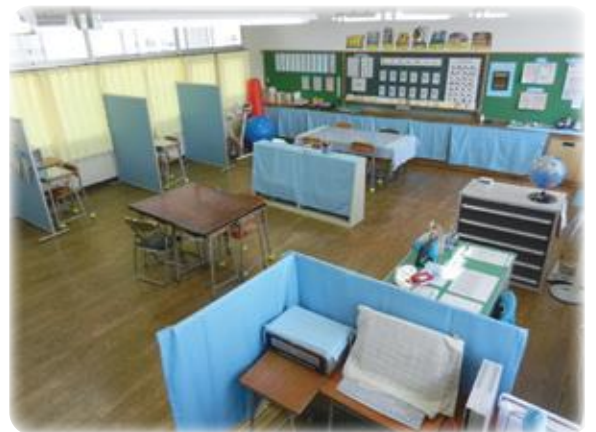
合理的配慮による教室環境（特別支援学級）