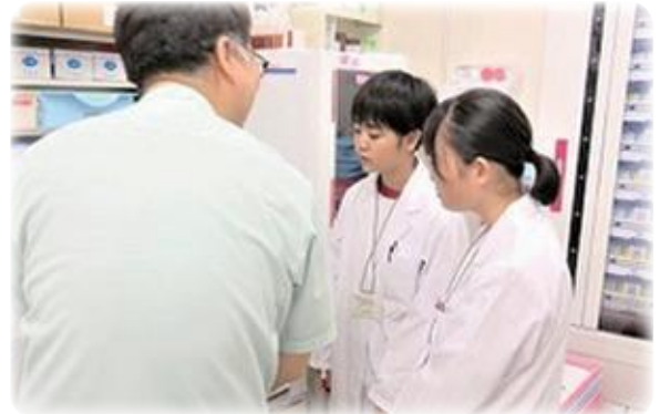
薬局での職場体験学習