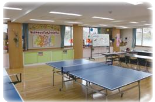
教育支援教室「フレンドリールーム」 (大分市教育センター)