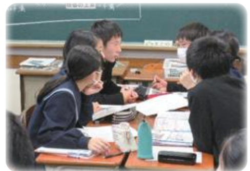
グループでの話し合い活動(社会科)