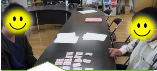
「決まり字」を覚える練習をしました

フレンドリールームでは、百人一首を20枚ずつ5色に色分けした「五色百人一首」を使います。今年は青色の札を使い、練習を重ねました。上の句が詠まれた段階で取札が分かるようになると、通級生の「はい！」という元気な声が響くようになりました。大会が行われた2月6日(月)は、真剣な眼差しで札を見つめる通級生の手によって勢いよく払われた札が宙を舞いました。