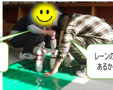
レーンの左は少し凸凹が あるから気を付けよう