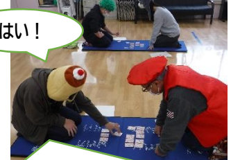
上の句で相手の持ち札を取っています！すごい！！