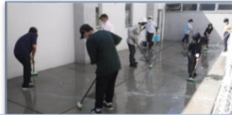
【犬舎の掃除】 汚れが落ちるまで何度もブラシで擦ります