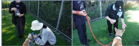
【犬の散歩】 餌を待つ姿が かわいい