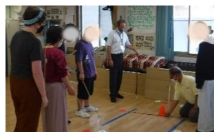
【CDカーリング】 コーンに近いのはどれ? 正確に計測します