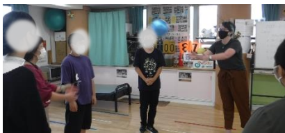
【フルーツバスケット】 英語と日本語の発音の違いにびっくり!