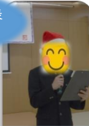
通級生代表 あいさつ