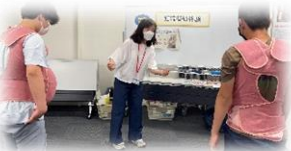
高齢者と妊婦の体験をしました

「大分市人権啓発センター」で人権学習をし、「大分市美術館」では美術鑑賞とワークショップに参加しました。