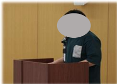
落ち着いた 司会ぶりです

発表会では、緊張の中、司会や代表のあいさつから始まり、書道パフォーマンスでは、「FR 皆楽修結」の文字を一人一人順番に、大勢の観客の前で堂々と書きました。そして、5人の通級生が書いた文字を台紙に貼り、作品を披露しました。パフォーマンス後は、文字に込めた思いや2学期のフレンドリールームでの思い出を、一人一人自分の言葉で発表しました。それぞれの役割を立派にやり遂げ、みんな達成感で満たされた表情でした。