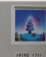
小学5年生 イラスト