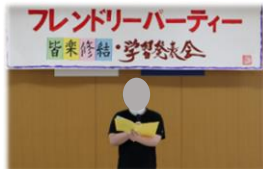
はじめの言葉を 堂々と述べました