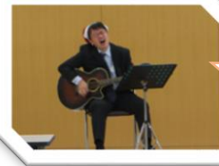
会場を包み込む 温かい弾き 語りでした