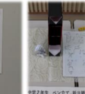
中学2年生 ペン立て 折り紙