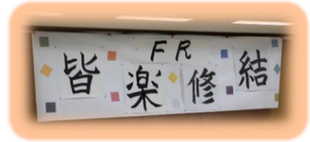
みんなの想いをつなげて 一つの作品になりました

スペシャルゲストとして職員が弾き語りをし、心癒される歌声でした。個別の通級生の作品展示(折り紙、工作、絵、卒業論文等)もあり、これまでの活動の集大成となりました。