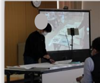
思いを込めて 力強く書きました