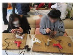
ホットボンド工作中