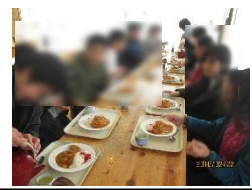
美味しい食事に笑顔いっぱい