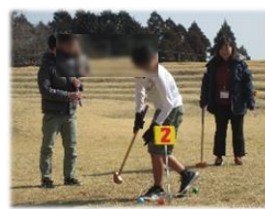
チーム対抗 グラウンドゴルフ