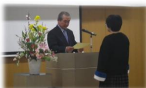
修了証書を一人一人に手渡しました