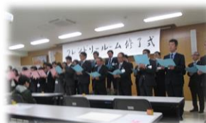
センター職員からのエールです