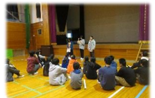
下級生が司会を頑張りました

1・2年生が計画・準備・運営するレクリエーション「OXクイズ」「けいどろ」「ピラミッドじゃんけん」をみんなで楽しみました。振り返りでは、「1・2年生がしっかり司会・進行を務めていた」「初めて会った人とも一緒に活動ができたし、3年生といい思い出ができた」などの感想が聞かれ、交流が深まりました。